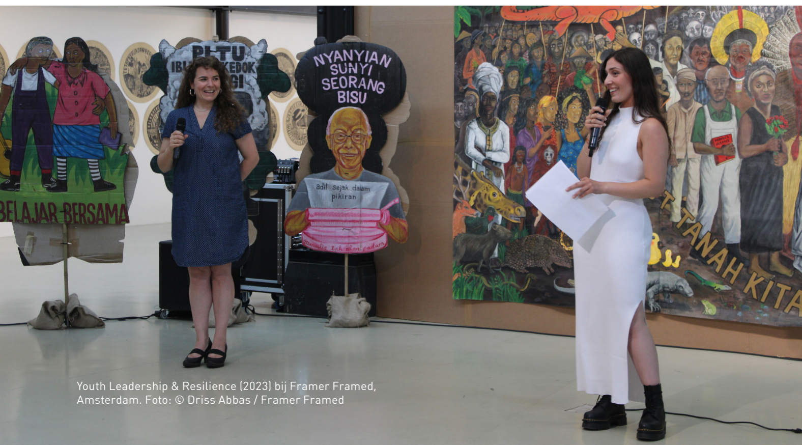
Youth Leadership & Resilience (2023) bij Framer Framed, Amsterdam.

Ook nieuw zijn de kwartaalfeesten die we organiseerden voor alle deelnemers van PAO en de overige cliënten van het ASKV. Elk kwartaal is de theaterzaal bij Ru Paré afgehuurd, werd er gekookt door een aantal cliënten of deelnemers en waren circa 50 cliënten en deelnemers aanwezig om samen te eten. De kwartaalfeesten zijn een soort reünie voor cursusdeelnemers. Bovendien zorgt het voor verbinding en leren cliënten ook weer nieuwe mensen kennen. Ze ervaren zo even het gevoel van uiteten gaan, kunnen bijpraten en nieuwe contacten opdoen.